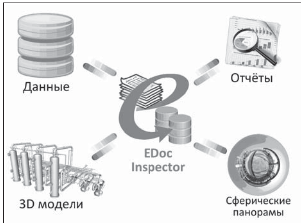
Рис. 2. Типы информации, объединяемые информационной системой EDocInspector

Комфортная работа — простой и логичный интерфейс минимизирует время, необходимое для ввода данных в систему. Все необходимые функции доступны из основного окна программы. Реализована возможность создания отчета по необходимым данным в печатной форме, а также экспорт данных в формат Microsoft Office Excel.