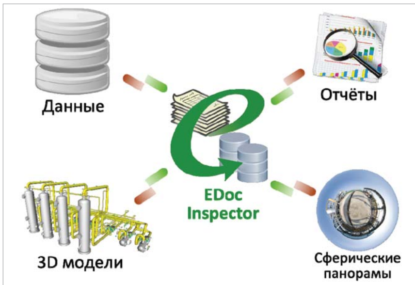
Рис. 2. Типы информации, объединяемые информационной системой EDocInspector

а также экспорт данных в формат Microsoft Office Excel.